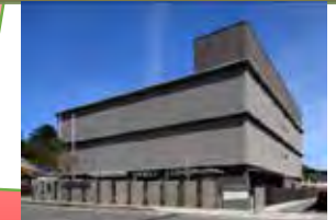
オフサイトセンターの外観