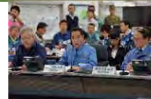
原子力総合防災訓練の様相