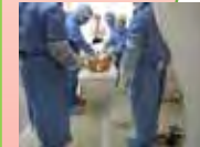
原子力災害医療体制の整備