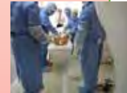
原子力災害医療体制の整備