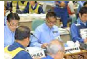
原子力総合防災訓練の様式