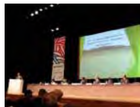
国際会議の様子(イメージ)