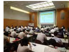
研修の様子(イメージ)