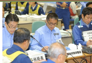
原子力総合防災訓練の模様