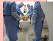
原子力災害医療体制の整備