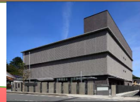
オフサイトセンターの外観