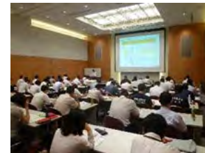
研修の様子 (イメージ)