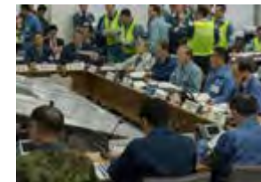
訓練の様子 (イメージ)