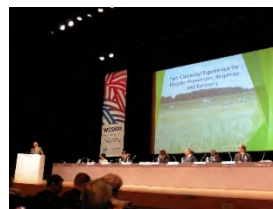
国際会議の様子 (イメージ)