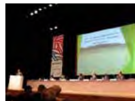
国際会議の様子(イメージ)