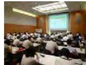
研修の様子(イメージ)