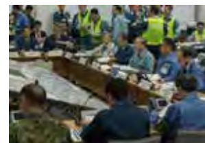
訓練の様子(イメージ)