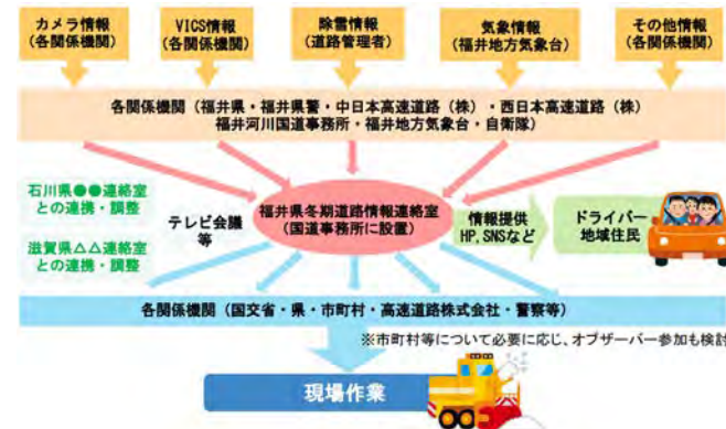
<福井県における情報連絡本部(例)>