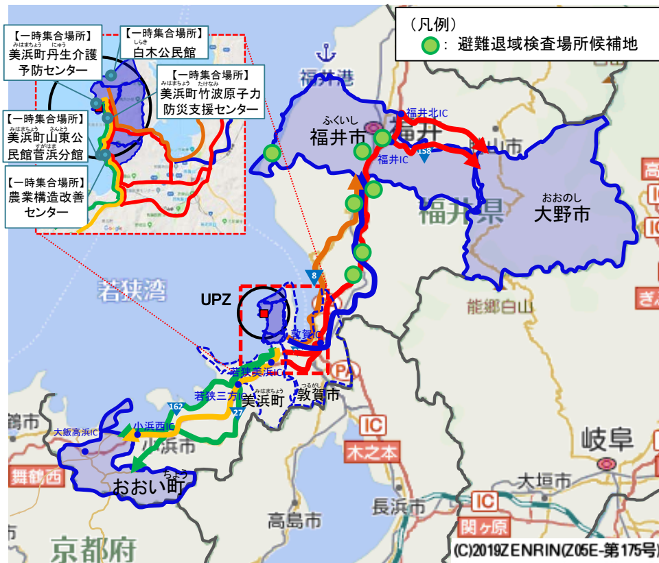
避難退域時検査場所及び避難先自治体(基本経路)