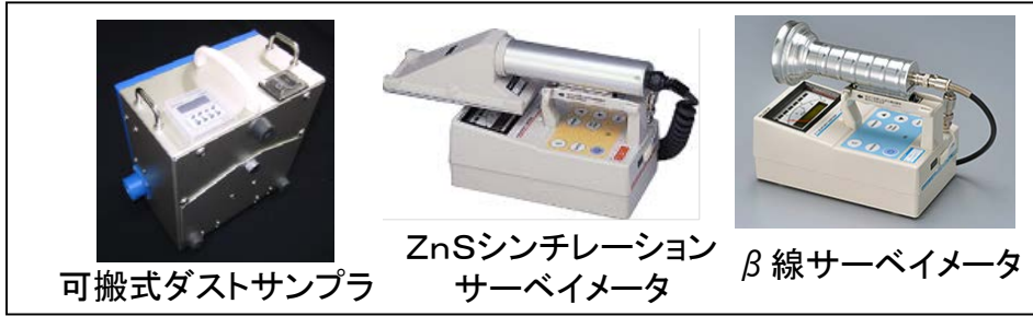
主な可搬型放射線計測装置の例