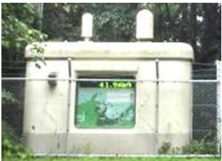
モニタリングポスト等【6局】