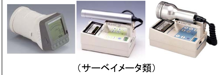
モニタ車に搭載する可搬型測定機材の例