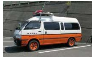
モニタリングカー【1台】