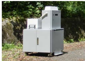
可搬型モニタリングポスト【10台】 (衛星系回線による通信機能付)