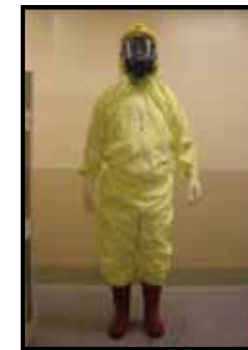
タイベックスーツ