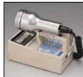
サーベイメータ(GM管)