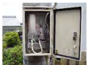
自主防災組織は各地区の防災行政無線屋外拡声子局に設置された双方向通信機により、情報共有