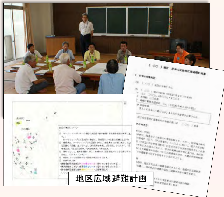
伊方町内全55地区でワークショップを開催 地区ごとの広域避難計画を策定