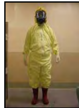
タイベックスーツ