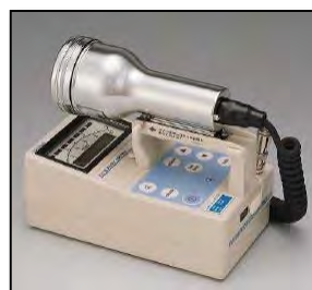
サーベイメータ(GM管)