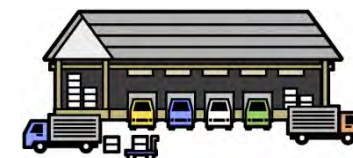
安定ヨウ素剤集積所