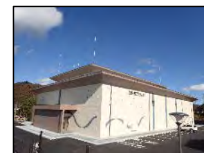
おながわ 宮城県女川オフサイトセンター