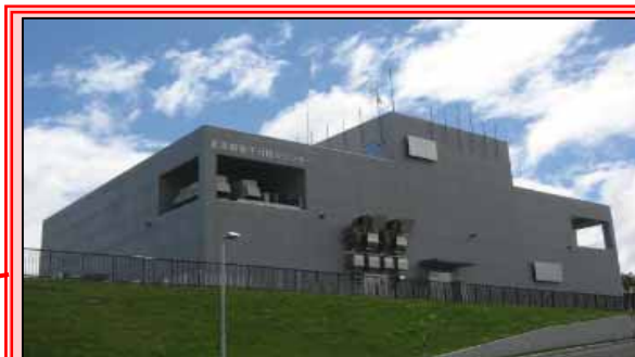
オフサイトセンター (共和町) (北海道原子力防災センター) 発電所からの距離約10km

仮にオフサイトセンターが機能不全に陥った場合でも、 代替オフサイトセンターに移動し、対応可能