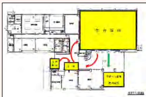
バス集合場所内のレイアウト図