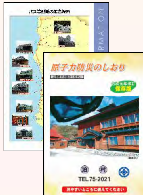
原子力防災のしおり (バス集合場所の地図等を記載)