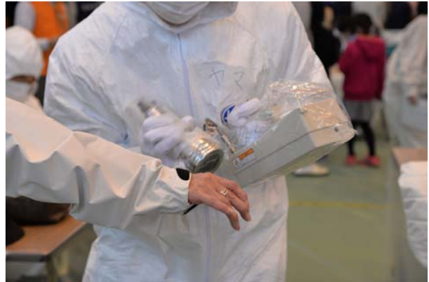
避難退域時検査② (かほく市県立看護大学)