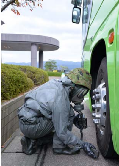
車両のスクリーニング (かほく市県立看護大学)