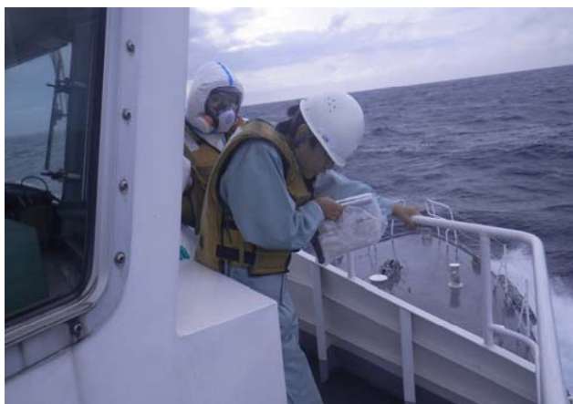
海上モニタリング活動②（志賀町沖）