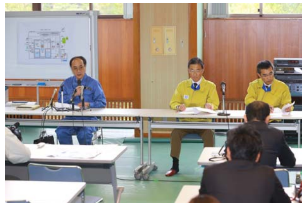
本部会議を受けた現地記者会見（OFC）