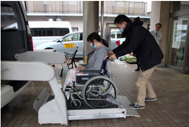
要援護者の避難① (白山市特別養護老人ホーム)