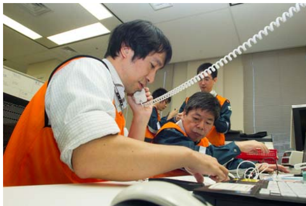
事業者からの通報受信（ERC）