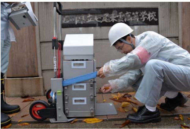
可搬型モニタリングポストの設置（七尾市）