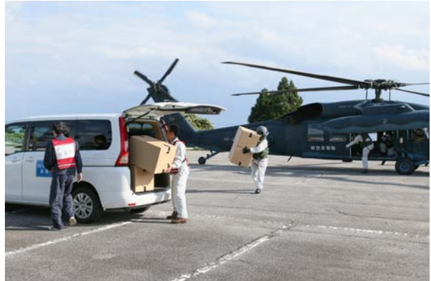
物資輸送活動② (能登町藤波台運動公園)