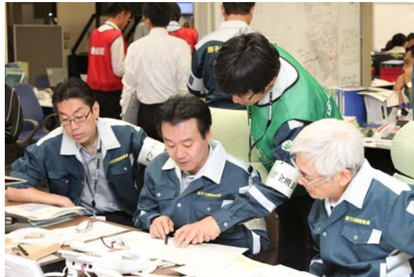
住民防護活動状況の確認（ERC）