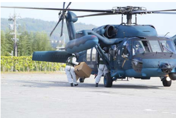
物資輸送活動① (能登町藤波台運動公園)