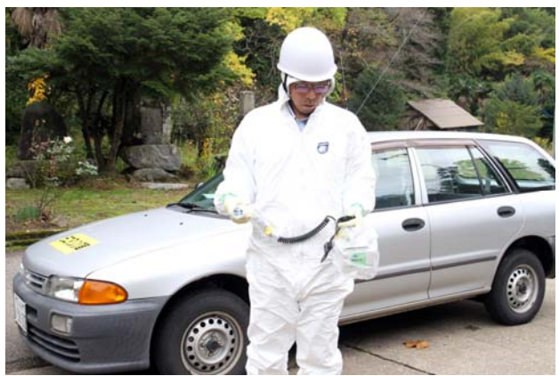
地上モニタリング活動（宝達志水町）