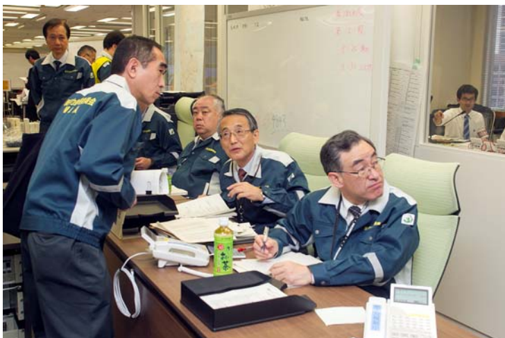
初動対応時の情報収集活動（ERC）