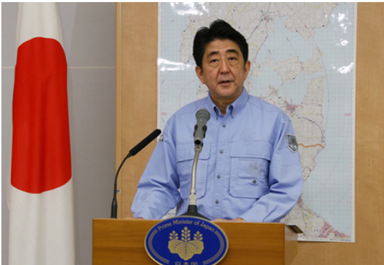
内閣総理大臣による緊急事態宣言（官邸）