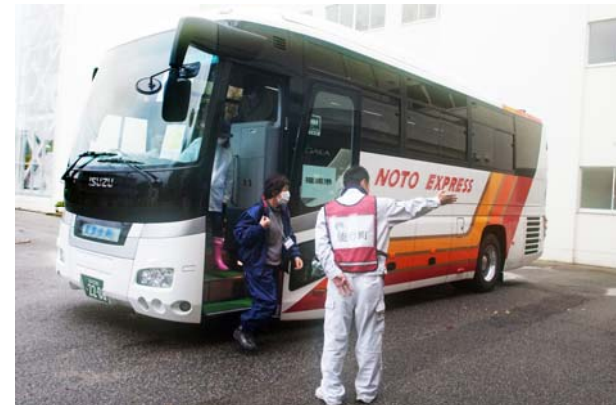
バスによる住民避難② (能登町)