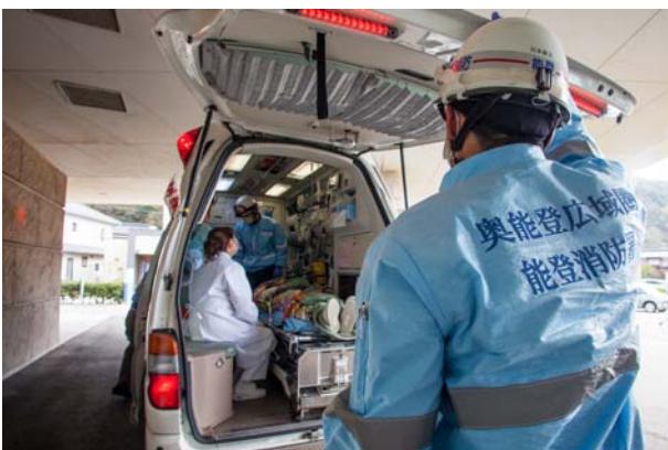
病院入院患者の輸送① (志賀町富来病院)