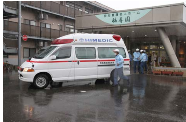
要援護者の避難② (白山市特別養護老人ホーム)