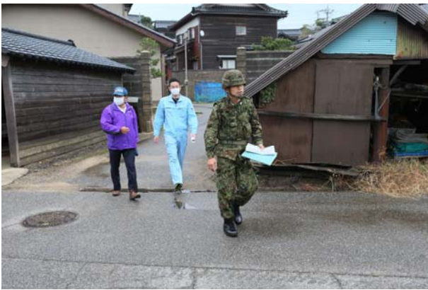
未避難者救助活動① (志賀町)