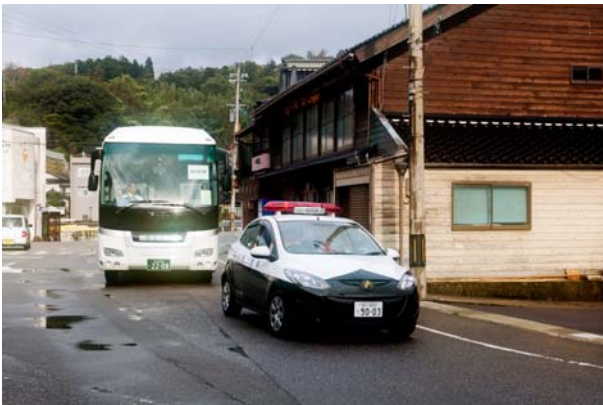
バスによる住民避難① (志賀町)