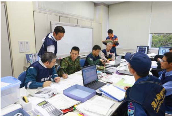
避難実施状況の確認① (OFC)