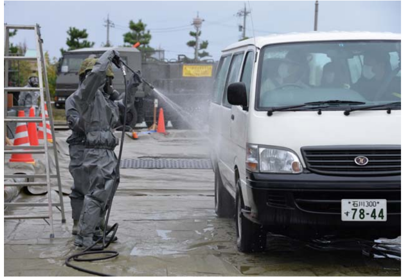
車両の除染活動 (かほく市県立看護大学)