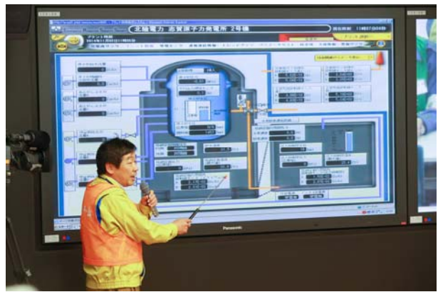
プラントの事態進展状況の共有（OFC）