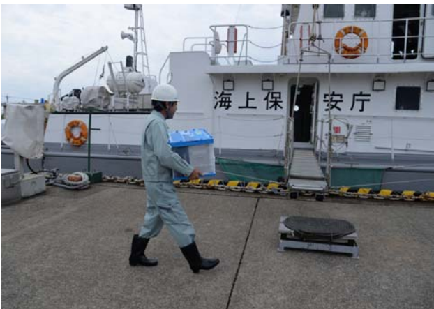
海上モニタリング活動①（金沢港）