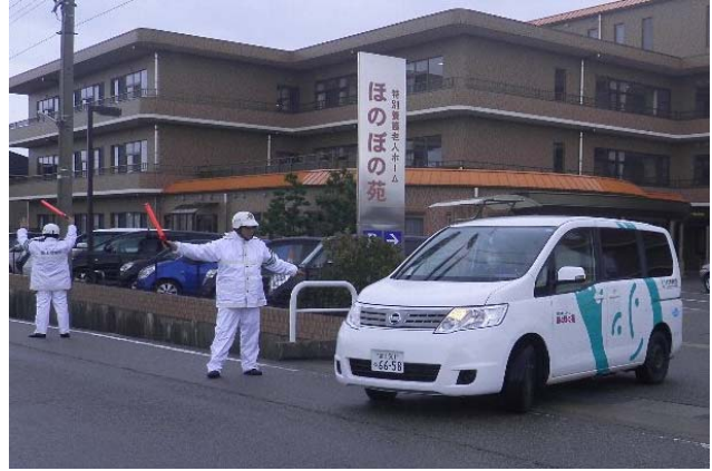
要援護者施設の避難活動支援（氷見市）