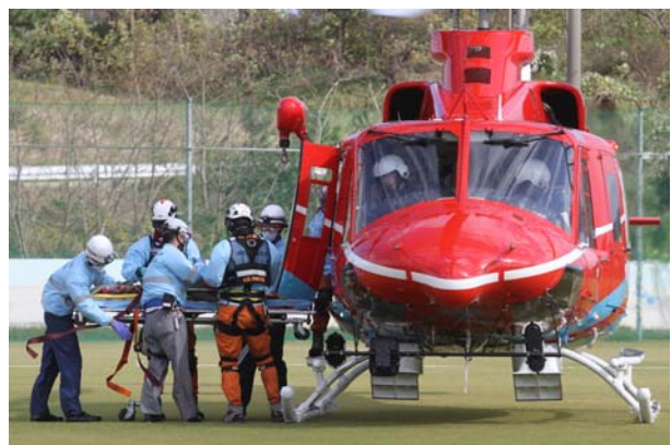
病院入院患者の輸送② (志賀町県立健民ホッケー場)