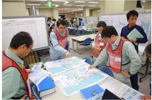
緊急時モニタリング活動の準備 (OFC)