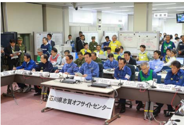
原子力災害対策本部会議への現地からの参加 （OFC）