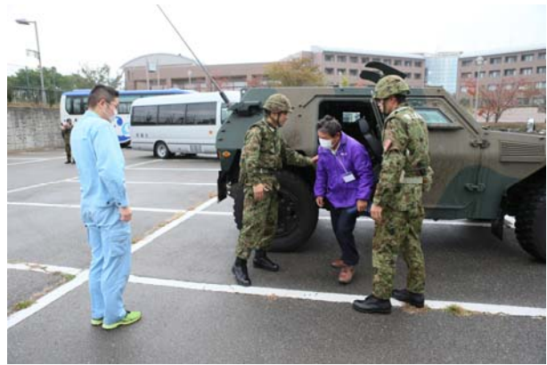
未避難者救助活動② (志賀町)