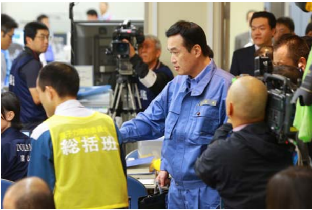
副大臣が現地対策本部（OFC）へ到着 （12：30）