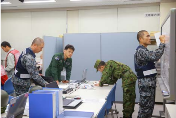
避難住民の把握、輸送経路の確認 (OFC)