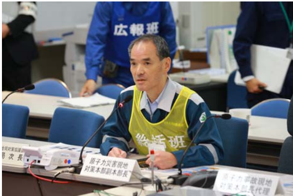
原子力事故合同現地対策本部の設置（OFC）