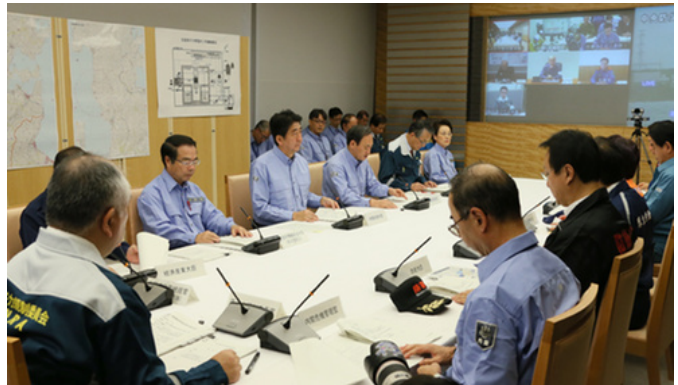
第1回原子力災害対策本部会議（官邸）