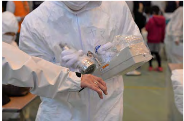
避難退域時検査② (かほく市県立看護大学)