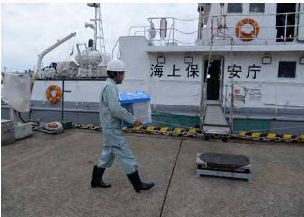
海上モニタリング活動①（金沢港）