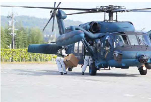
物資輸送活動① (能登町藤波台運動公園)