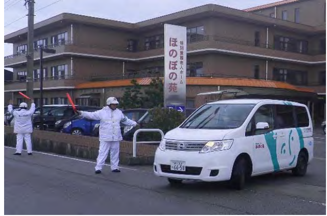
要援護者施設の避難活動支援（氷見市）