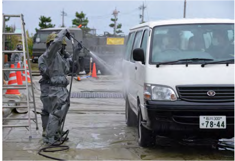
車両の除染活動 (かほく市県立看護大学)