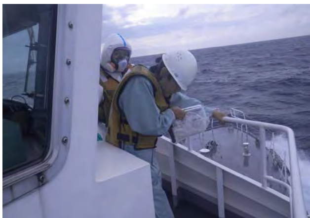
海上モニタリング活動②（志賀町沖）