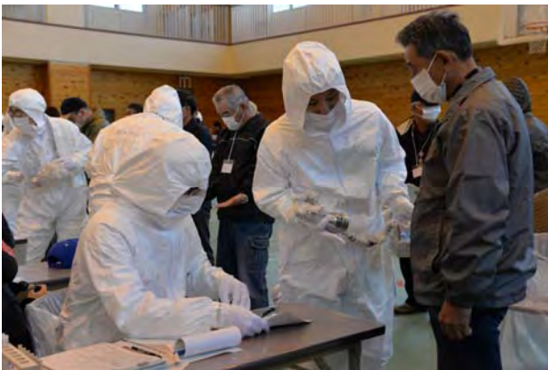
避難退域時検査① (かほく市県立看護大学)