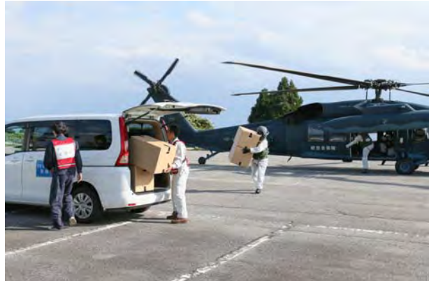
物資輸送活動② (能登町藤波台運動公園)