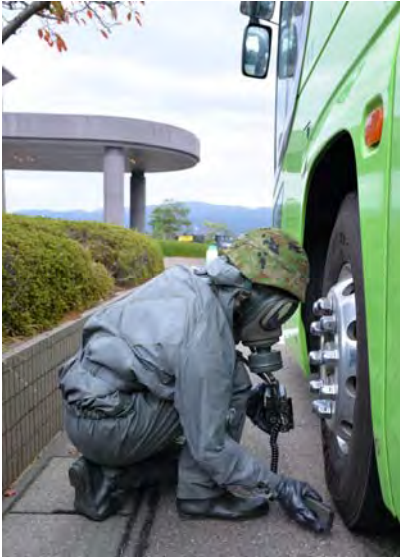
車両のスクリーニング (かほく市県立看護大学)