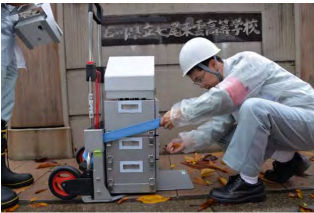
可搬型モニタリングポストの設置（七尾市）