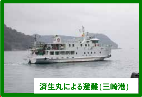
済生丸による避難(三崎港)