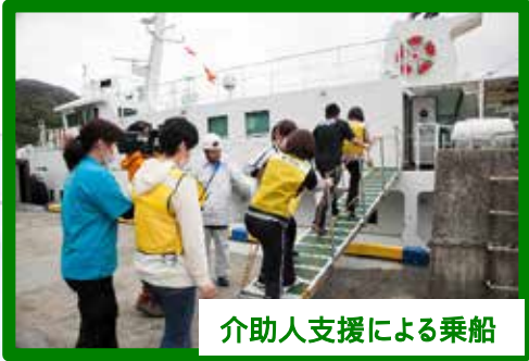
介助人支援による乗船