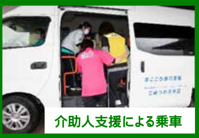
介助人支援による乗車