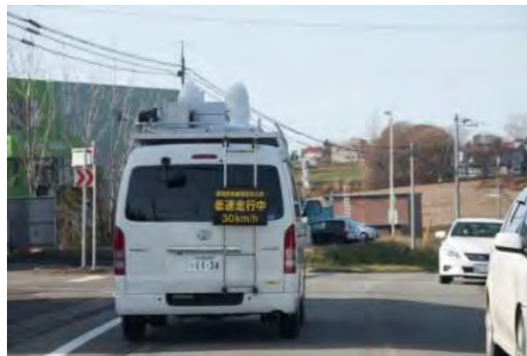
モニタリングカーによる走行サーベイ