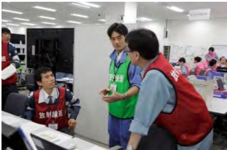
放射線班と住民安全班の調整