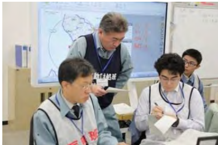
医療班と実動対処班の調整