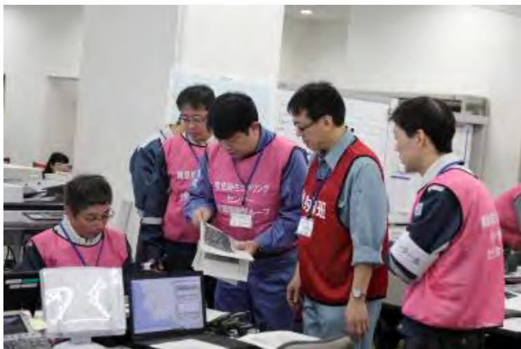
EMCと放射線班の調整