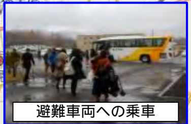
PAZ内要避難者の避難実施結果