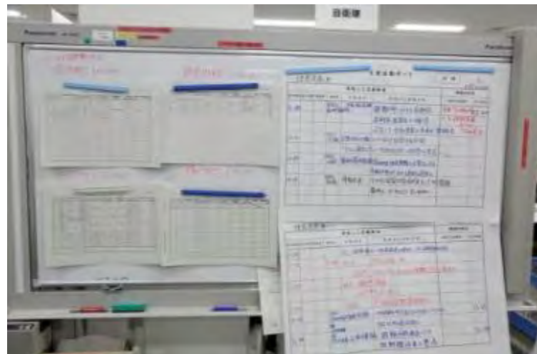
一時移転の状況把握