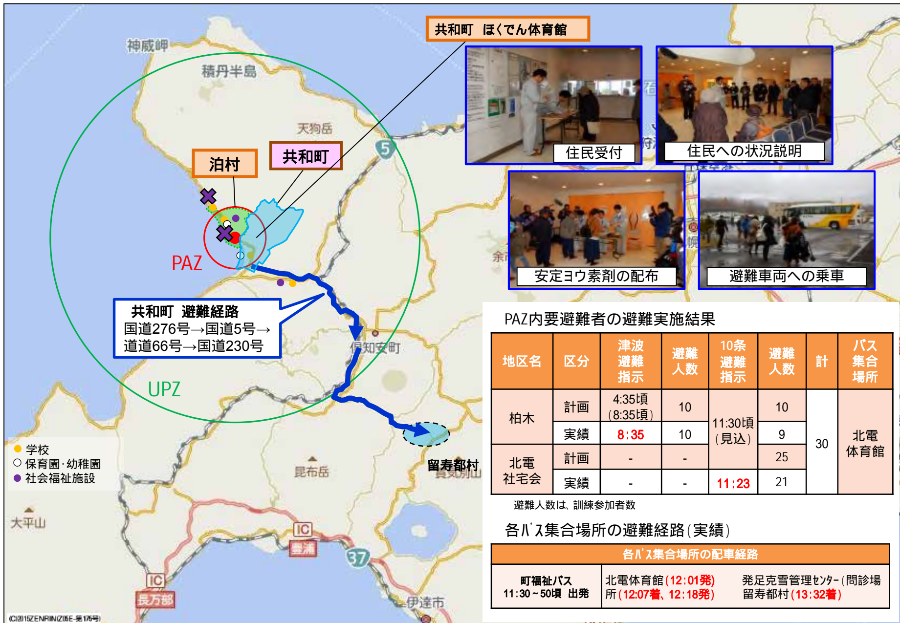
共和町 ほくでん体育館