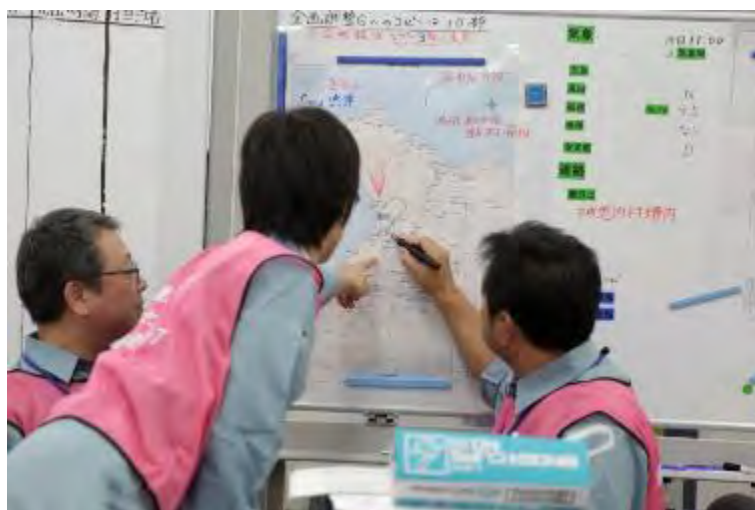
緊急時モニタリング結果の確認