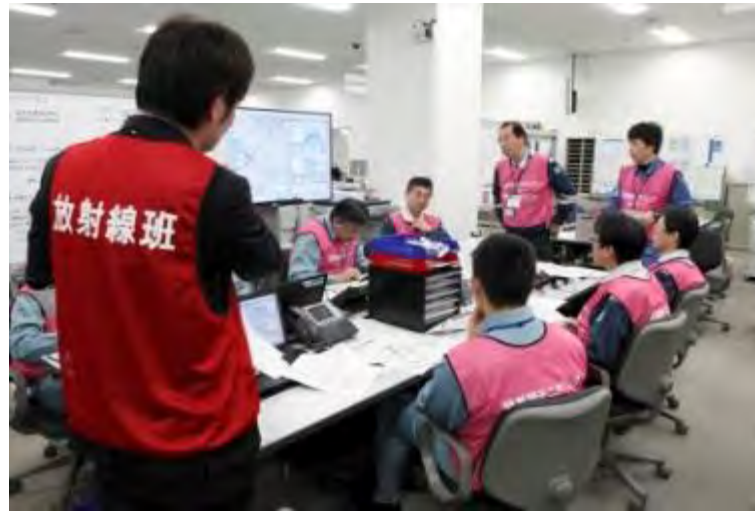
EMCと放射線班の調整活動