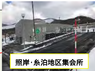
照岸・糸泊地区集会所