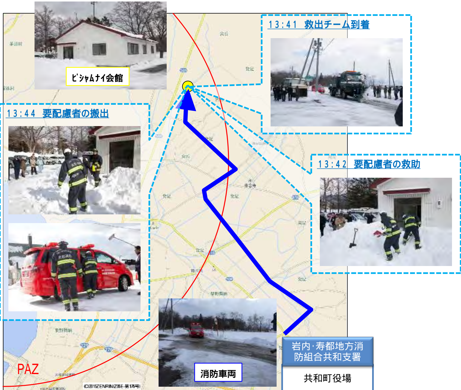
ビシャムナイ会館