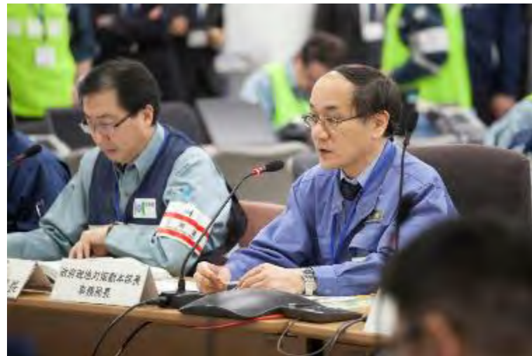
第2回原子力災害合同対策協議会（P A Z内住民の避難状況の確認）