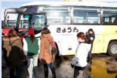
14:30 避難住民のバス乗り込み開始