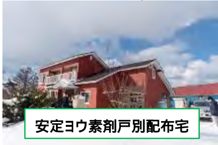
安定ヨウ素剤戸別配布宅