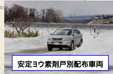
安定ヨウ素剤戸別配布車両