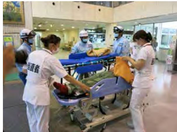
高浜病院入所者の搬送