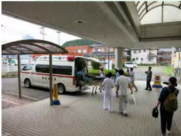
高浜町 在宅要支援者(重篤患者)の高浜病院への搬送