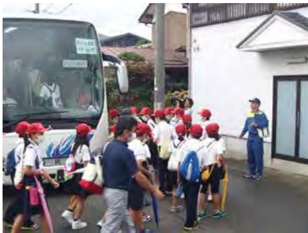
高浜小学校児童のバス避難