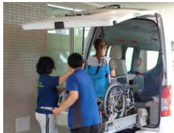
社会福祉施設「バースайд」気比の杜での要支援者受入