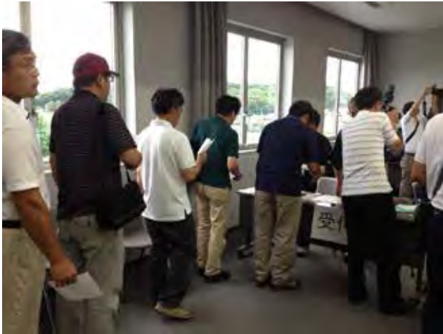
高浜町和田地区住民の避難の様子