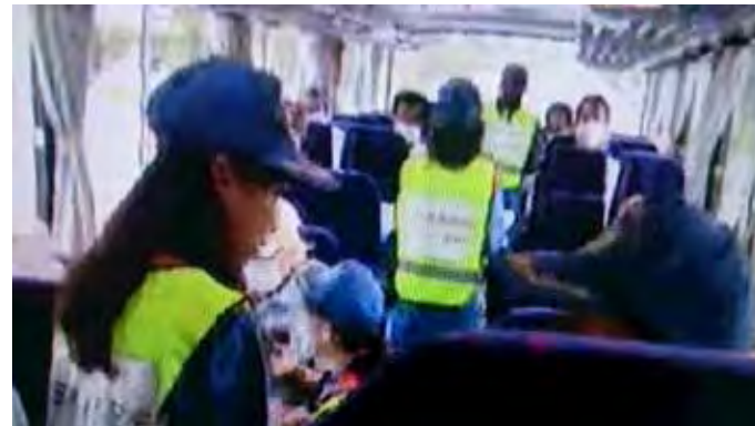
バス車内において安定ヨウ素剤服用の説明、簡易問診後に配布を実施(高浜町和田地区)