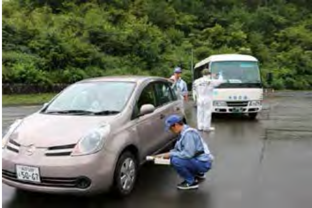
あやべ球場(京都府)における福井県避難車両の避難退域時検査