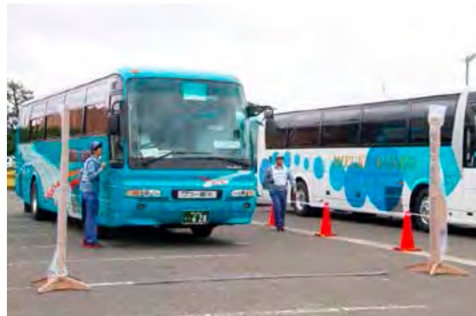
避難退域時検査 ゲート型モニタによる車両スクリーニング(美浜町役場)