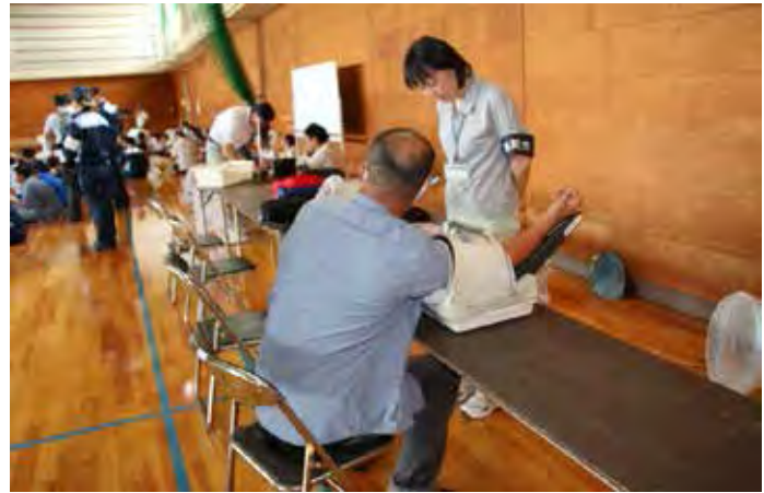
受付後に健康チェックを実施