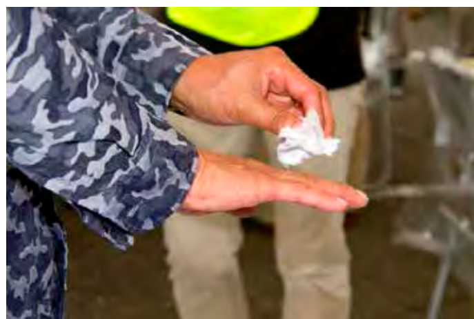
ウエスによる汚染箇所の簡易除染(美浜町役場)