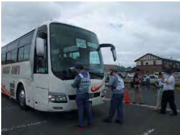
避難退域時検査 車両スクリーニング(美浜町役場)