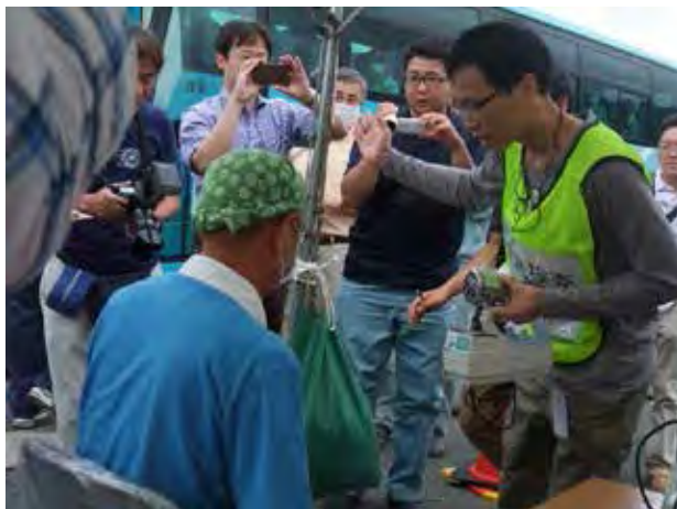
避難者に対するスクリーニング(美浜町役場)