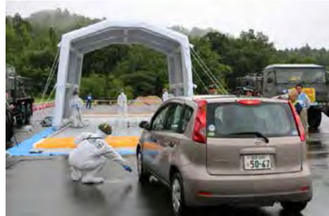
実動部隊による水除染の実施