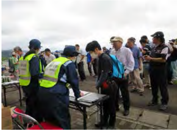
安定ヨウ素剤の配布(小浜食文化館)