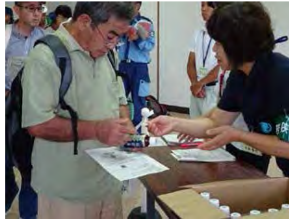
安定ヨウ素剤の配布(若狭町上中庁舎)