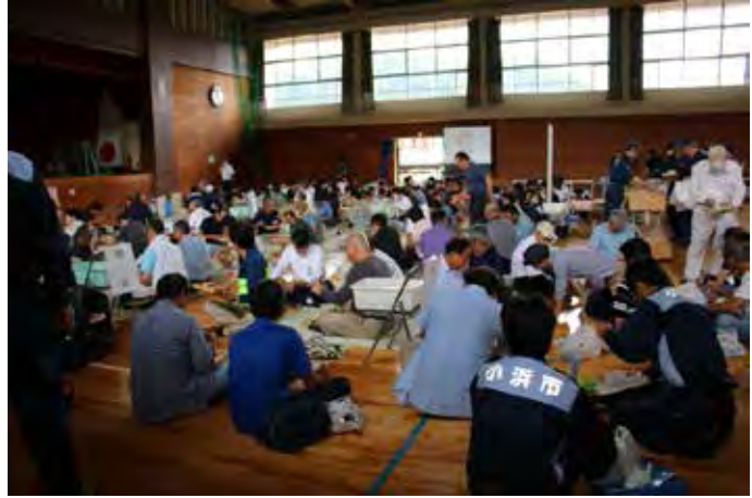
小浜小、西津小、雲浜小児童、一般住民の県内避難(今立体育センター)