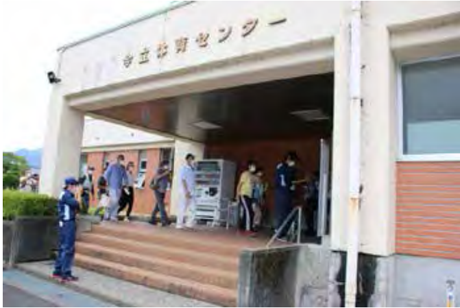
小浜小、西津小、雲浜小児童、一般住民の県内避難(今立体育センター)