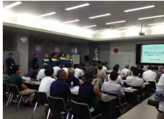
高浜町和田地区住民の避難の様子(三田市消防本部)