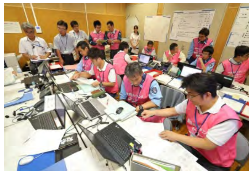
緊急時モニタリング結果の確認