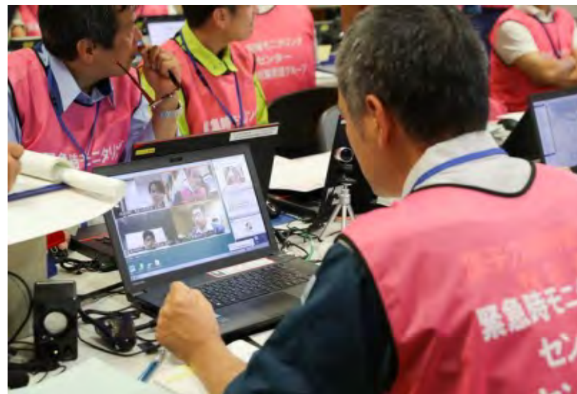
P C T V会議を用いた各拠点間情報共有