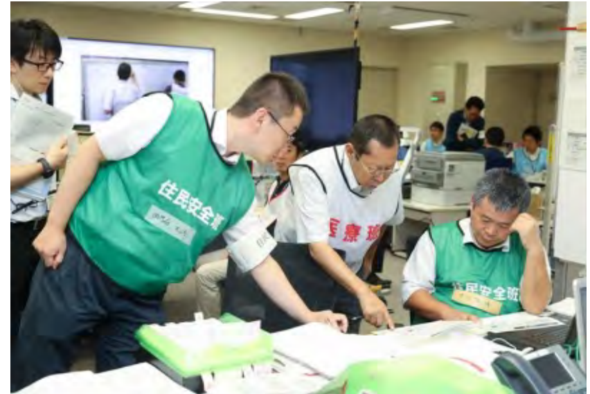
医療班と住民安全班の調整