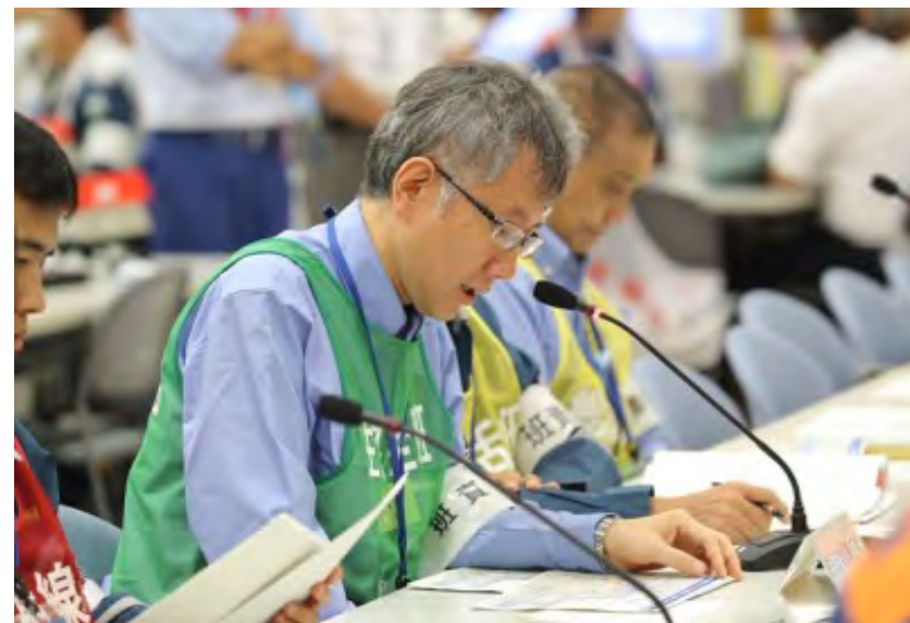
第5～7回原子力災害合同対策協議会（一時移転の実施状況の確認）