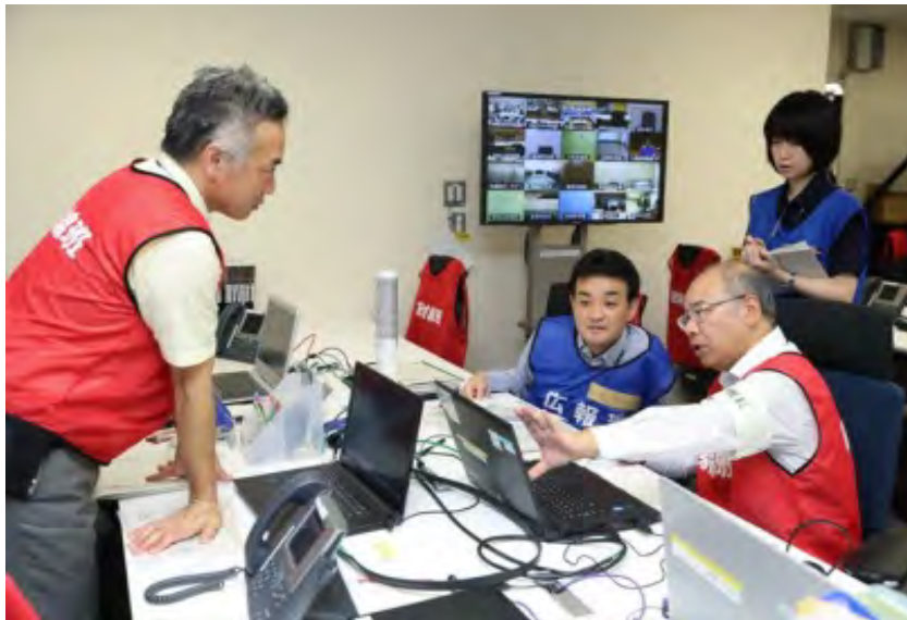
放射線班と広報班の調整