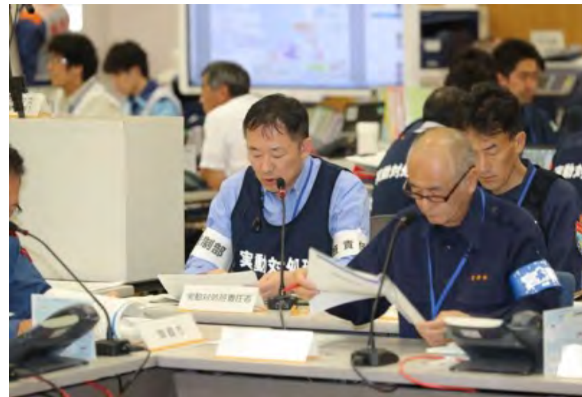
第2～4回原子力災害合同対策協議会（一時移転の指示）