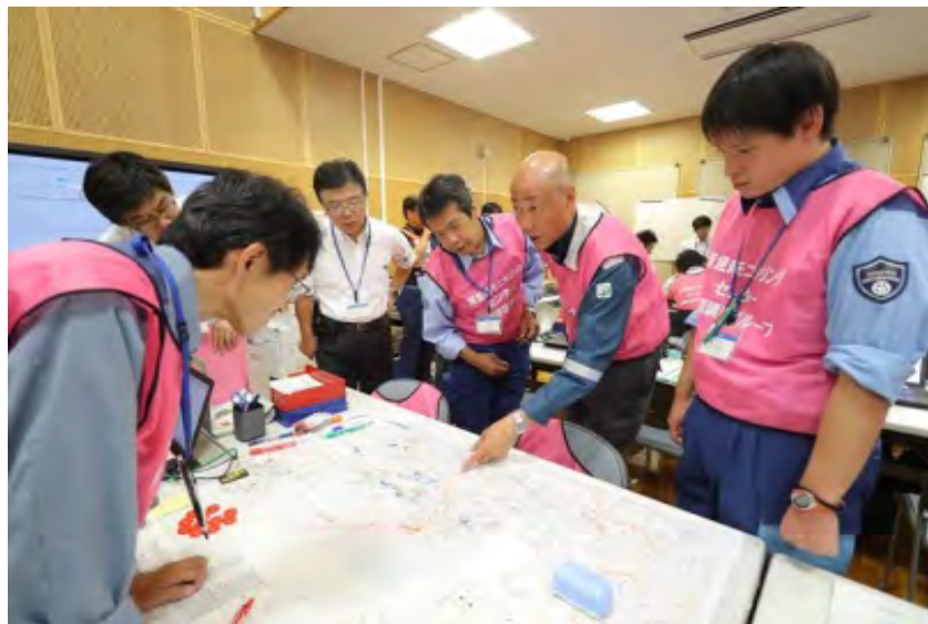
緊急時モニタリング結果の報告