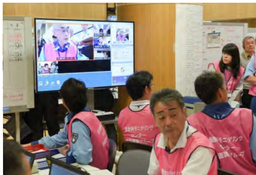
PCTV会議を用いた拠点間情報共有