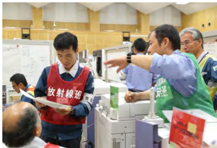
放射線班、住民安全班及び総括班の調整