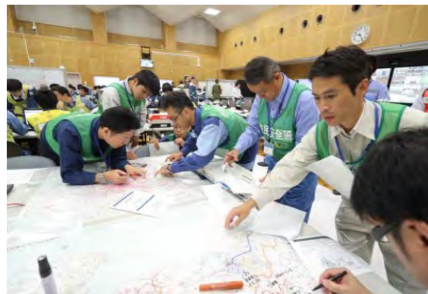
一時移転の状況把握