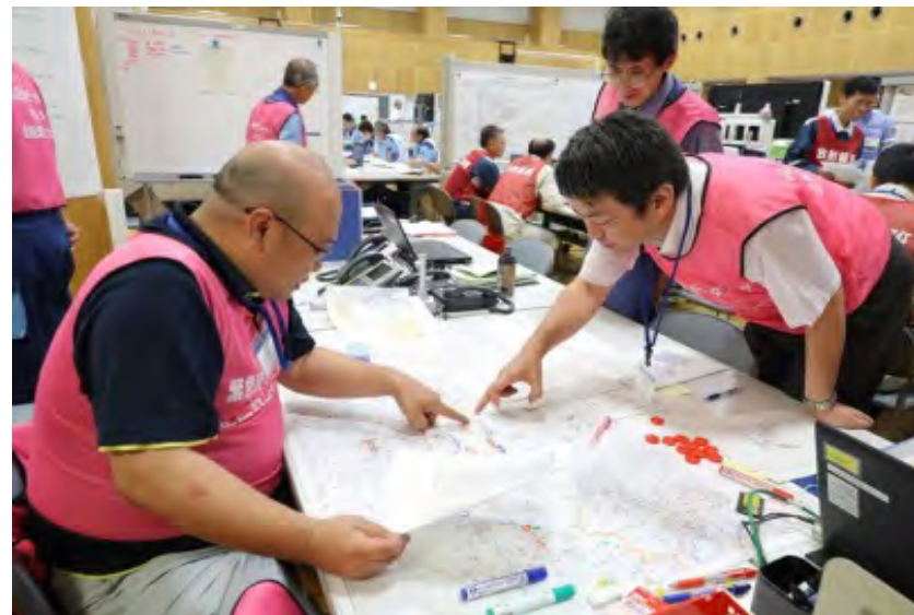
緊急時モニタリング結果の共有