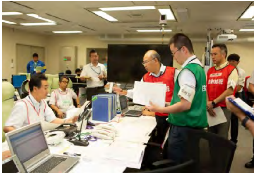
機能班からオフサイト総括へ報告