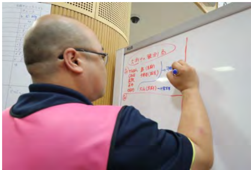
緊急時モニタリング活動の共有