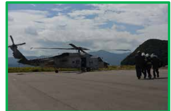
はまかせ交流センター(おおい町)から、海上自衛隊ヘリにより搬送される急病人