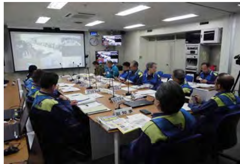
西部総合事務所の活動