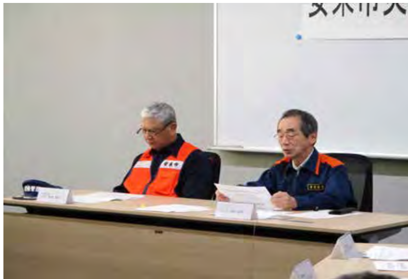
災害対策本部会議