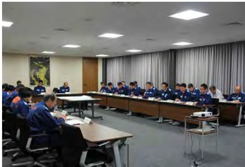
災害対策本部会議