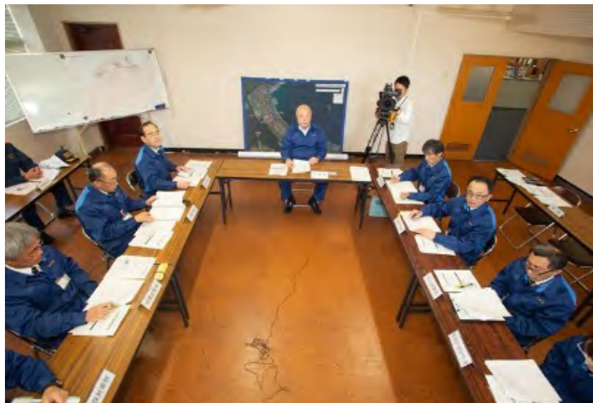
鳥取県主催第1回合同会議での本部長による状況報告