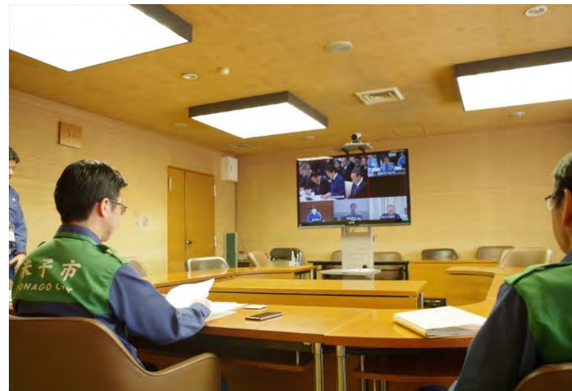
原子力災害対策本部・非常災害対策本部合同会議の傍聴