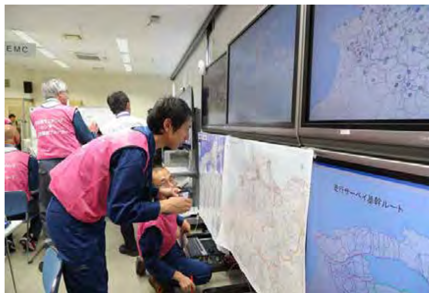
モニタリング情報の見える化