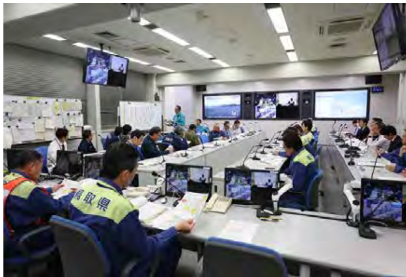
第1回県災害対策連絡会議