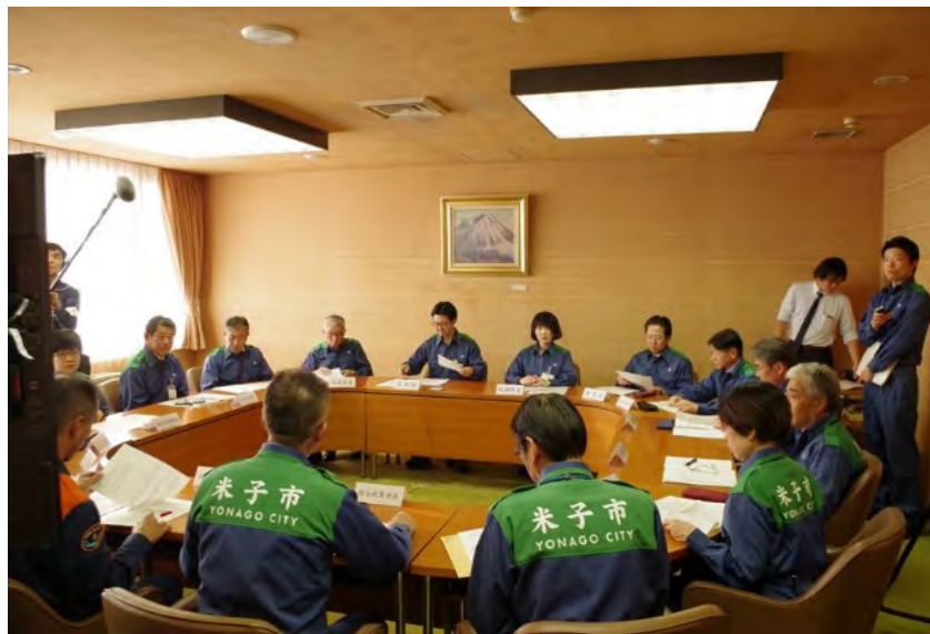
災害対策本部会議