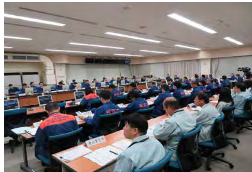
災害対策本部会議