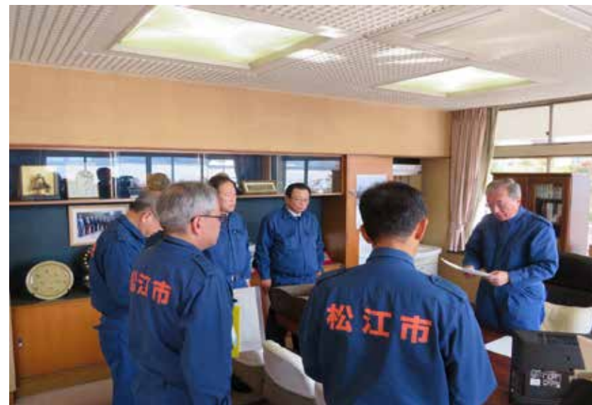
本部長からの指示