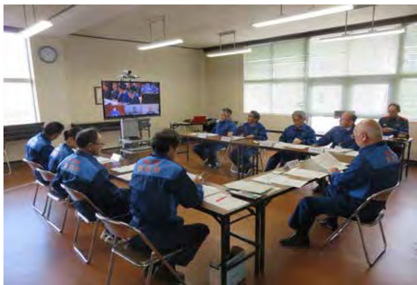
原子力災害対策本部・非常災害対策本部合同会議の傍聴