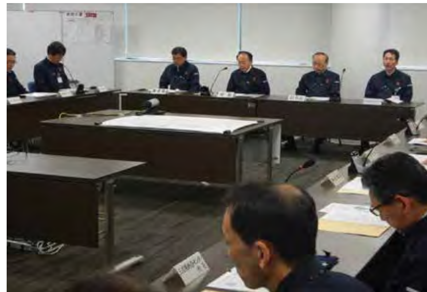
災害対策本部会議