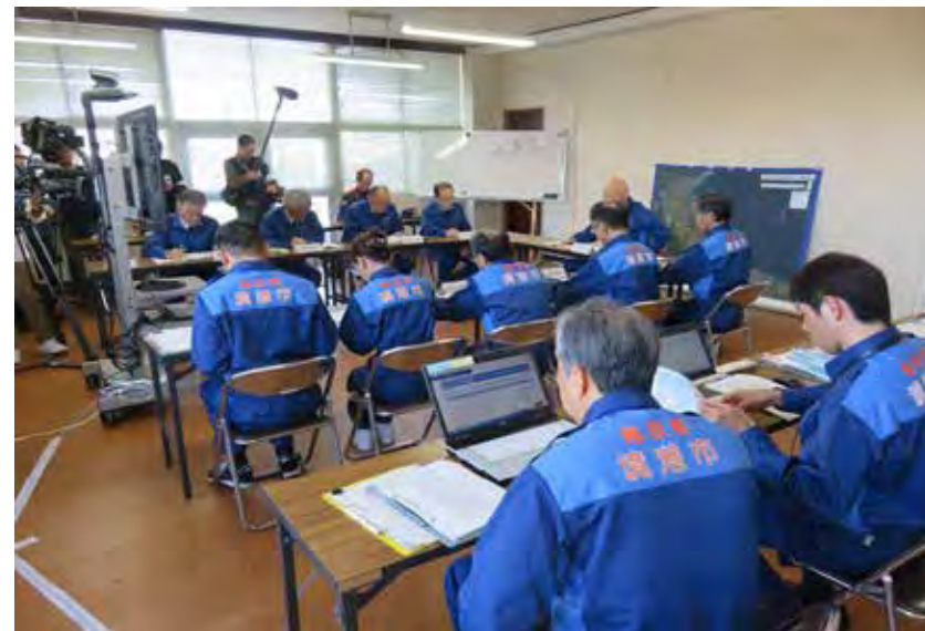
災害対策本部会議