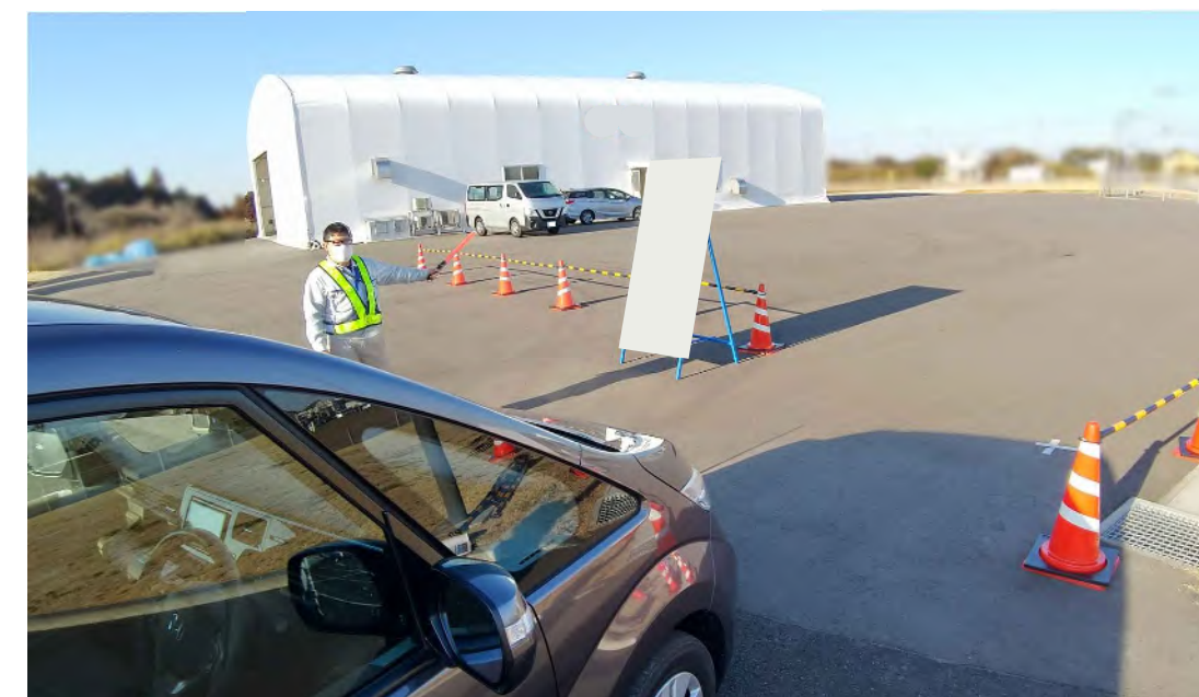
避難退域時検査会場入口