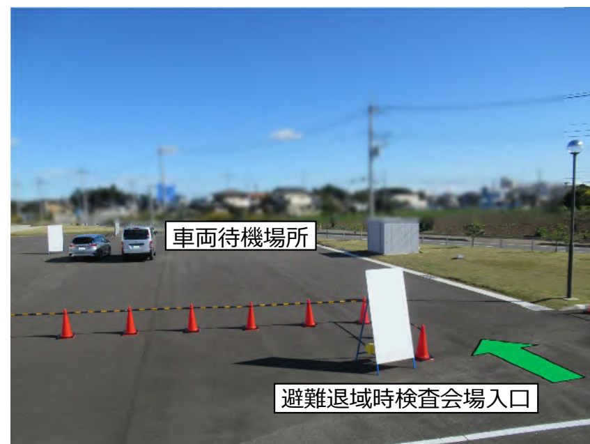
避難退域時検査会場入口・車両待機場所