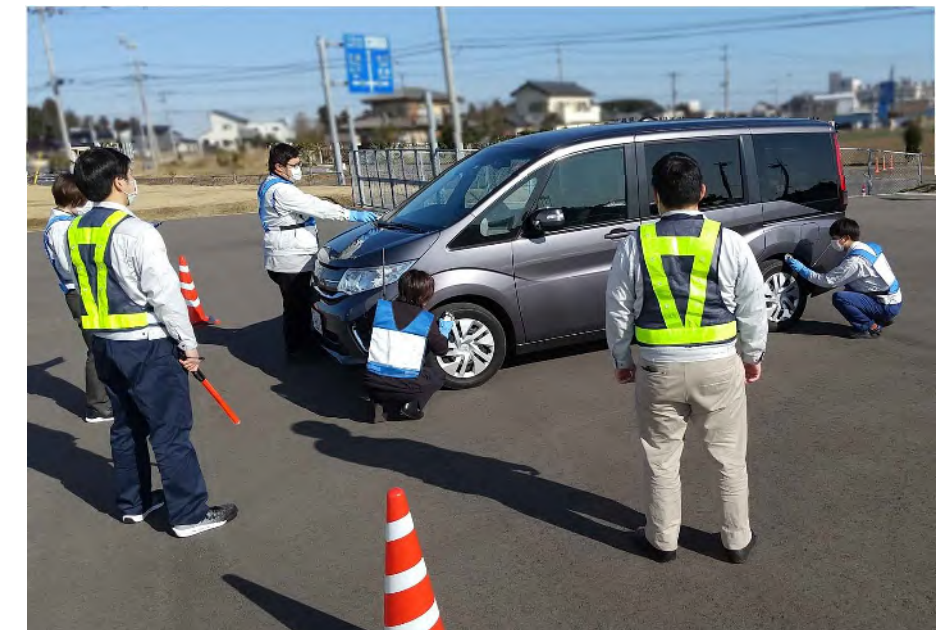
車両確認検査の様子