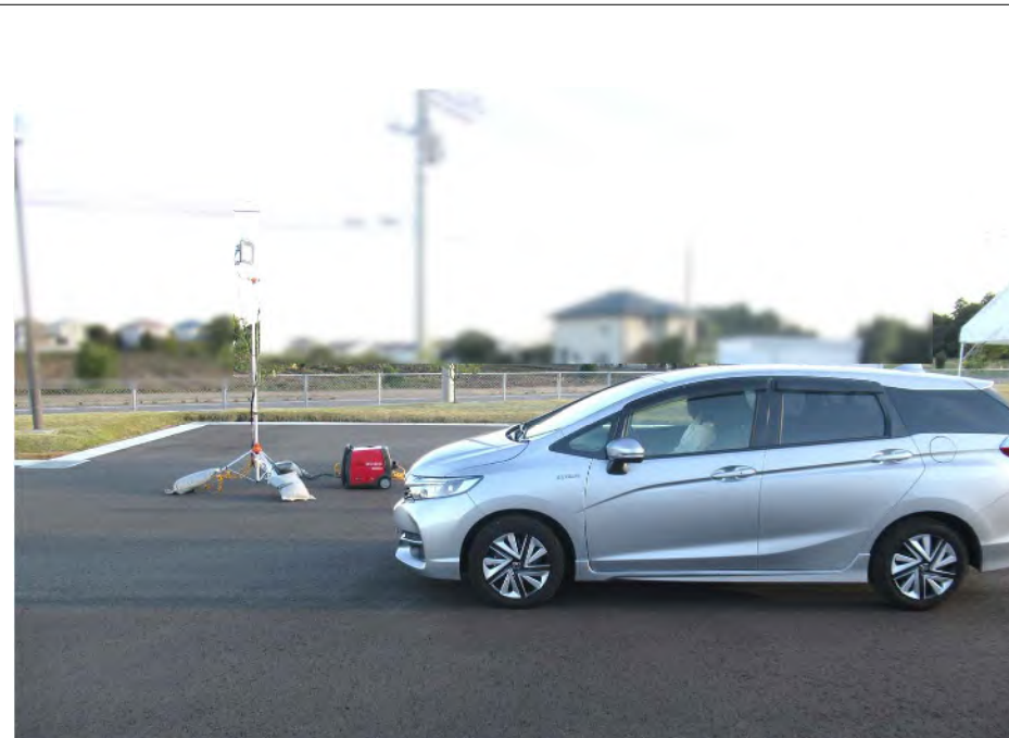
車両確認検査場所