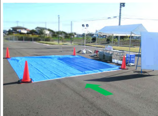
車両簡易除染・確認検査場所