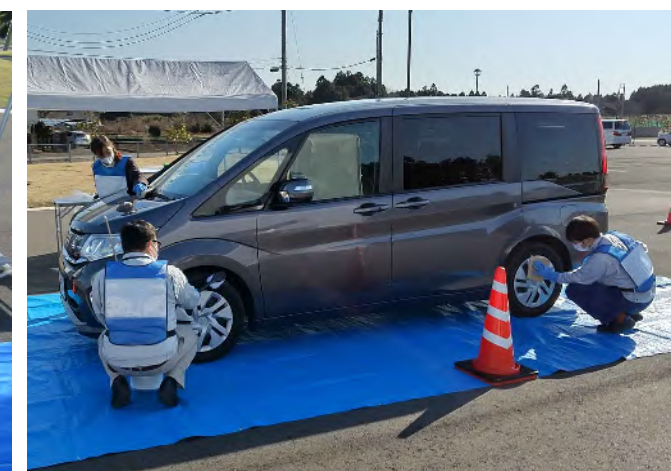
車両簡易除染の様子