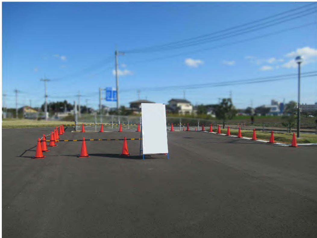
車両一時保管場所