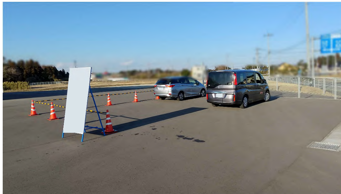
車両一時保管場所入口