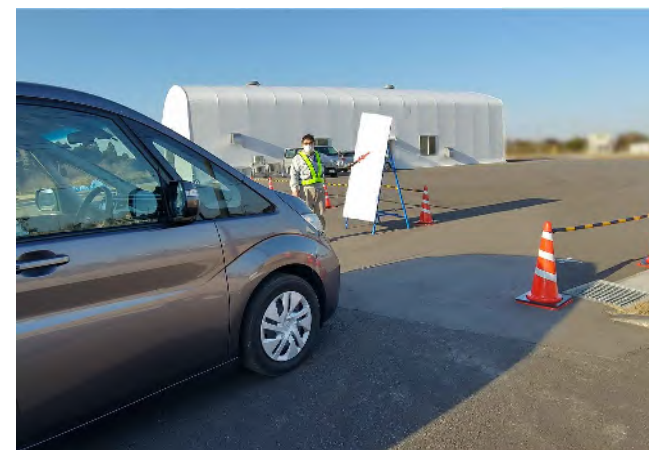
避難退域時検査会場入口付近の 車両誘導係A