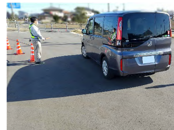
分岐地点付近の 車両誘導係E