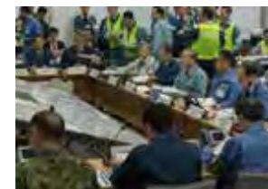
訓練の様子(イメージ)