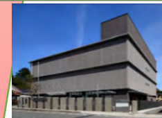
オフサイトセンターの外観