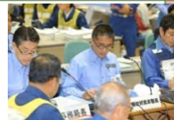
原子力総合防災訓練の模様