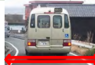
局部的な避難経路の改修