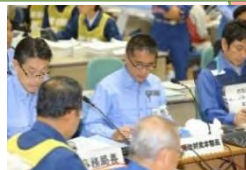
原子力総合防災訓練の様相