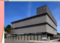
オフサイトセンターの外観