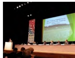
国際会議の様子(イメージ)