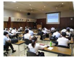
研修の様子(イメージ)