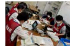
原子力被災者生活支援チームによる机上訓練の様子