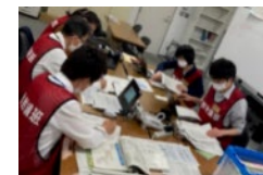
原子力被災者生活支援チームによる机上訓練の様子