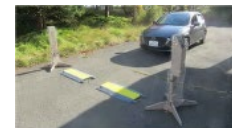
避難退域時検査(訓練)の様子