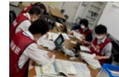
原子力被災者生活支援チームによる机上訓練の様子