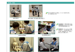
甲状腺被ばく線量モニタリング簡易測定 運用の手引きの検討