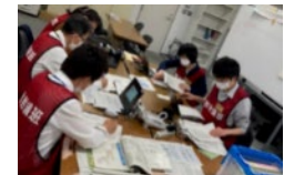
原子力被災者生活支援チームによる机上訓練の様子