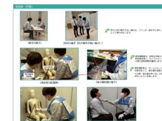
甲状腺被ばく線量モニタリング簡易測定 運用の手引きの検討