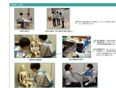
甲状腺被ばく線量モニタリング簡易測定 運用の手引きの検討