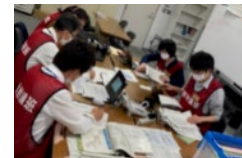
原子力被災者生活支援チームによる机上訓練の様子