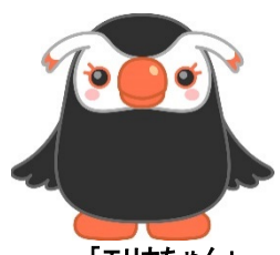
「エリカちゃん」 北方領土問題啓発キャラクター