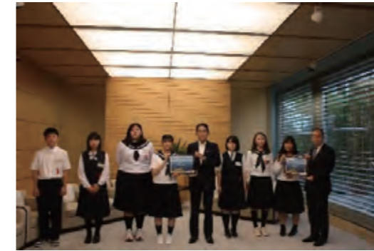
北方少年少女による総理大臣表敬

例年夏に、北方少年少女による総理大臣表敬や函館豆記者による北方領土関係の取材が行われています。