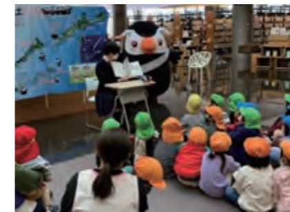
パネル展での読み聞かせ