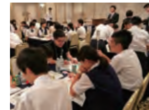
北方領土返還要求運動関東甲信越青少年交流会(群馬県)