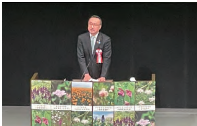
岡田内閣府特命担当大臣(沖縄及び北方対策)による挨拶