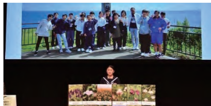
中学生によるスピーチの様子

大会は、3年ぶりに元島民や運動関係者等が参集し、併せて大会の様子をYouTubeで配信しました。