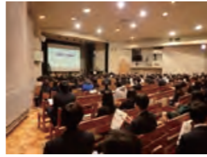
語り部活動の様子