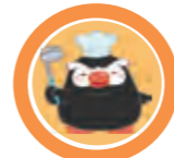
択捉島 エリマルくん

みんなに北方領土について知ってもらいたくて、生まれたんだっぴ！北方四島が大好きで、四島それぞれにエトピリカのお友達が住んでるっぴ！全国のイベントに参加したり、各SNSでもイベント情報や北方四島に関する情報をみんなに発信しているっぴ！