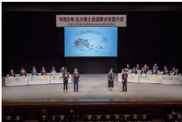
令和5年北方領土返還要求全国大会の様子

昭和56年1月の閣議了解により、毎年2月7日を「北方領土の日」と決めました。この日を中心として、北方領土返還要求全国大会を始め、各地で様々な事業が実施されています。なお、2月7日は、1855年に日露間の国境を択捉島とウルップ島の間で定めた日魯通好条約が調印された日です。