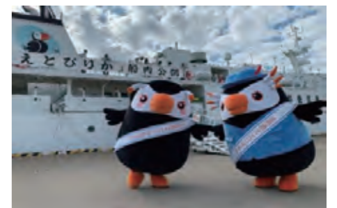
北方四島交流等事業使用船舶「えとびりか」 一般公開(北海道・根室港)