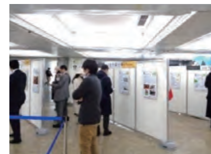
北方領土展2022 in Tokyo (東京・新宿駅)

全国各地でいろんなイベントを行っているっぴ！内閣府北方対策本部のホームページにもイベントの情報を掲載しているっぴ〜♪