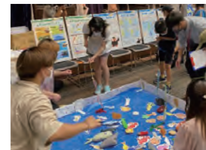
子ども霞が関見学デー (東京・永田町)

着ぐるみのエリカちゃん、エリオくんは全国各地で開催されているイベント等に登場し、一緒に啓発活動を行っています。着ぐるみは(独)北方領土問題対策協会により貸出しを行っています。