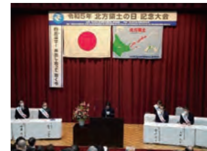
令和5年「北方領土の日」記念大会