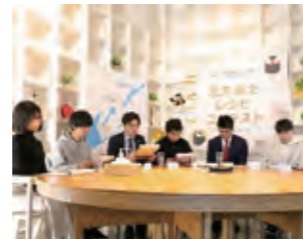
レシピコンテストの審査の様子