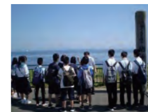
納沙布岬から北方領土を視察