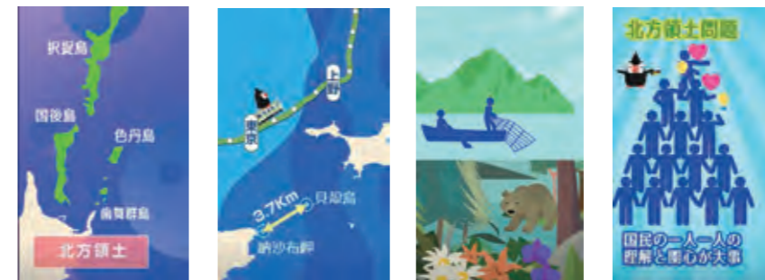
第1話『起の巻』 第2話『承の巻』 第3話『転の巻』 第4話『結の巻』

タイトルは『エリカの起承転結!!』とし、第1話『起の巻』では歴史を、第2話『承の巻』では地理を、第3話『転の巻』では島民を、第4話『結の巻』では外交・返還運動を主なテーマとして、若年層が短期間で印象的に学べるよう工夫しています。