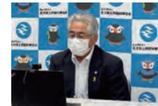
元島民による講話(オンライン)