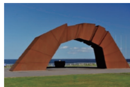
しま 「四島のかげ橋」

「四島のかげ橋」は、望郷の岬公園(根室市納沙布岬)に建つ北方四島返還祈念モニュメントで、北方領土返還を望む日本国民の強い意志を表すシンボルとなっています。