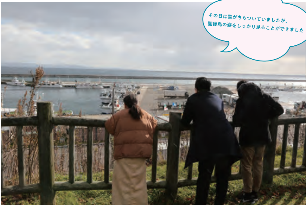
▲しおかぜ公園 (羅臼町)