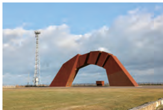
▲四島 (しま) のかけ橋と祈りの火

各都道府県から送られた石碑の中から、それぞれの出身地を見つけました！私の出身地である香川もありました！