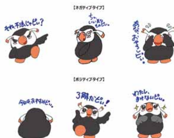
エリカちゃん LINEスタンプ (線画バージョン)