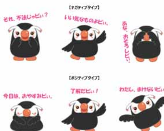
エリカちゃん LINEスタンプ (イラストバージョン)