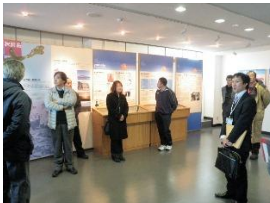
⑦べつかい乳業興社（会社見学およびバター作り体験）