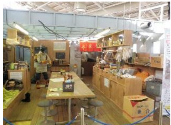
TBS 系列ドラマ「南極物語」のセット