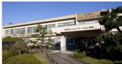
浜松市リハビリテーション病院 180床 指定管理者