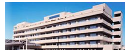
聖隷佐倉市民病院400床