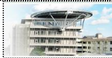
聖隷三方原病院934床