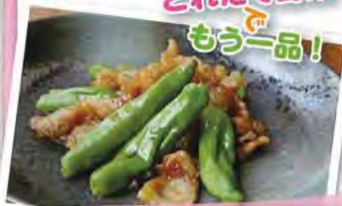
シシトウの甘酢炒め