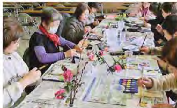
▲楽しく絵手紙作り

絵の構図や色合い、絵手紙に添える一言を考えるのは難しいですが、先生が熱心に指導して下さり、だんだんと上達しているのが分かるので楽しく続けています。