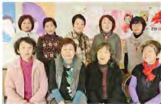
▶絵手紙教室のメンバー