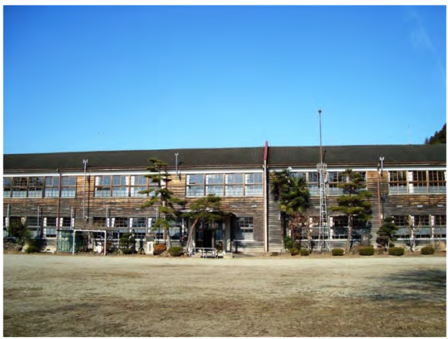
近隣の写真 [参照 google map]

フィルムコミッションでも使用される ノスタルジーさが残る建物を宿泊施設 に変えたい